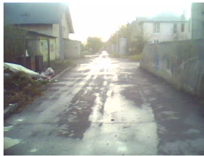
Пути движения к объекту ( от остановки транспорта ). № 11,12