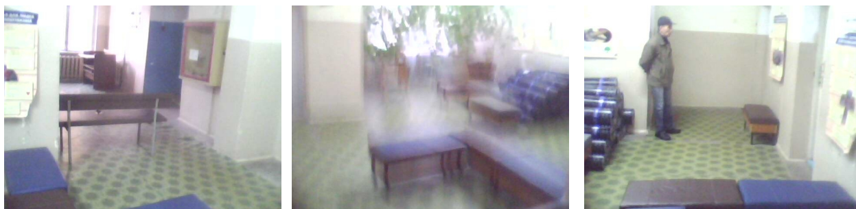
Пути движения внутри здания ( в. т.ч. пути эвакуации ) № 3,4,5