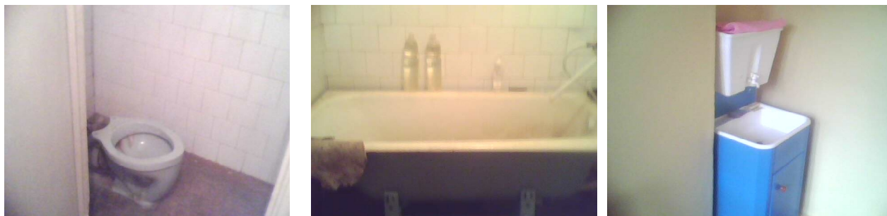
Санитарно-гигиенические помещения. № 6,7,8