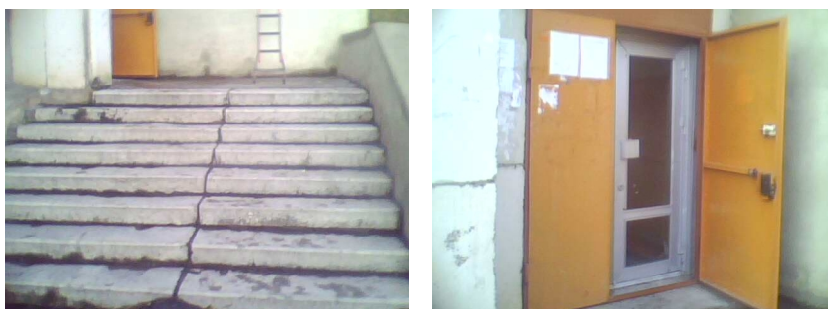
Входы ( выходы ) в здание. № 1,2.

Государственное автономное учреждение здравоохранения « Городская больница №2 г. Магнитогорск». Здравпункт. ул. Войкова 67