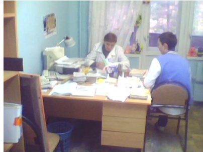
Зона целевого назначения здания ( посещения объекта) № 9,10